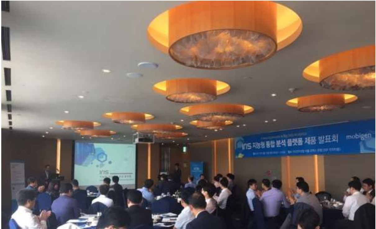
[제품발표회 행사 사진]